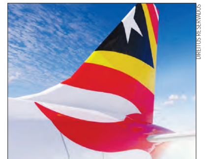
Várias rotas estão a ser planeadas

Segundo o empresário, atualmente estão a planear as rotas e à espera das autorizações finais do Governo, uma vez