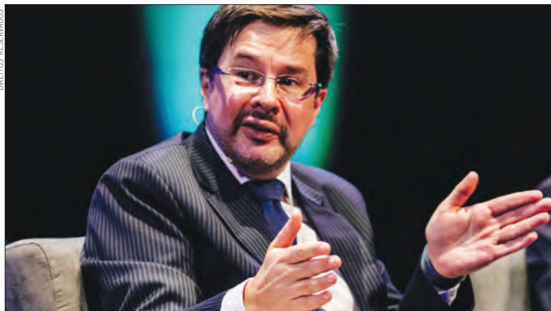
Thierry Ligonnière, presidente executivo da ANA - Aeroportos de Portugal

Para o responsável, “o projeto desta primeira fase da expansão do aeroporto de Lisboa coloca em cima de mesa a viabilidade do aumento de capacidade no aeroporto de Lisboa”, explicando que se trata de um projeto que conta com a criação de uma nova placa de estacionamento com possibilidade de colocar os aviões em contacto com a infraestrutura bem como