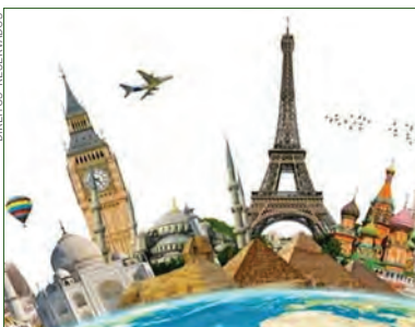
Recuperação pós Covid-19

Só nos meses de verão do hemisfério norte, entre julho e setembro, houve 340 milhões