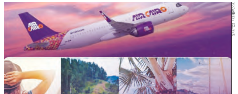
Operações diretas entre Lisboa, Assuão e o Cairo terão início a 30 de dezembro

Desde então, a Air Cairo transportou mais de 20 milhões