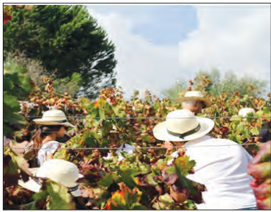
Rota do Vinho em Lisboa

O Museu do Vinho e da Vinha, em Bucelas, é também um dos locais sugeridos para uma viagem pela herança cultural da segunda mais antiga região de vinhos de Portugal,