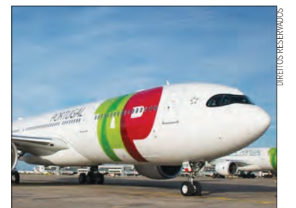
Cancelamentos a 8 e 9 de dezembro

A CEO da transportadora aérea nacional salientou que a