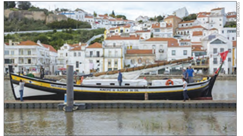
Apesar do frio do inverno, viagens mágicas aquecem a alma e o coração

Os passeios de Natal no galeão 'Pinto Luísa' para observação da iluminação natalícia da marginal e encosta da cidade ao som de música da época, enquanto se toma uma bebida quente e se come um bolo ou bolacha já são uma tradição em Alcácer do Sal.