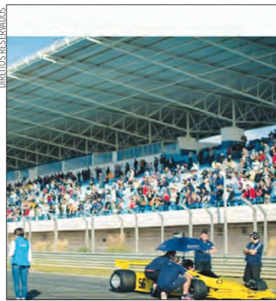
Estoril Classics, de 7 a 9 de outubro

A exemplo dos dois últimos anos, a maioria das 'jóias motorizadas' presentes no circuito nacional não estarão escondidas nas boxes, mas sim expostas em tendas, aonde os aficionados as poderão ver de perto e até trocar algumas ideias com os elementos das equipas que preparam estas raridades de quatro rodas. Outra tradição do Estoril Classics é a exposição do