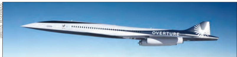
Os supersónicos Overture estarão prontos para seu lançamento em 2025

A maior companhia aérea do mundo, a American Airlines, anunciou que está pronta para ter a maior frota supersónica do mundo.