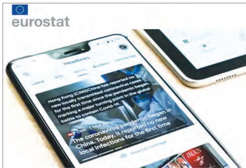
Dados representam uma descida face à percentagem de 2020

Por idades, a leitura de 'sites' de notícias, de jornais e de revistas de notícias na internet