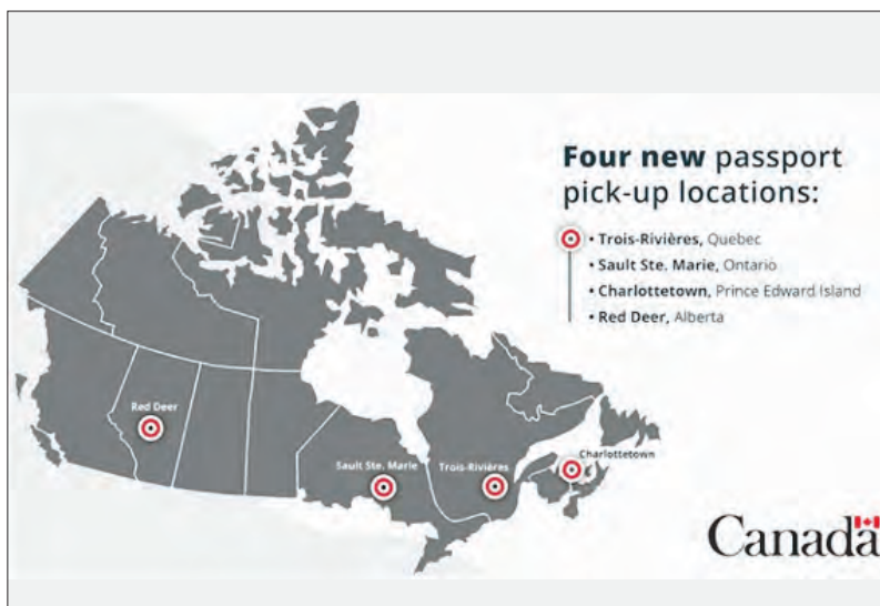
Novos escritórios para emissão de passaportes

A Ministra do Desenvolvimento Social, Karina Gould, anunciou que a partir de agora os cidadãos canadianos poderão recolher passaportes nos centros de serviço do Canadá