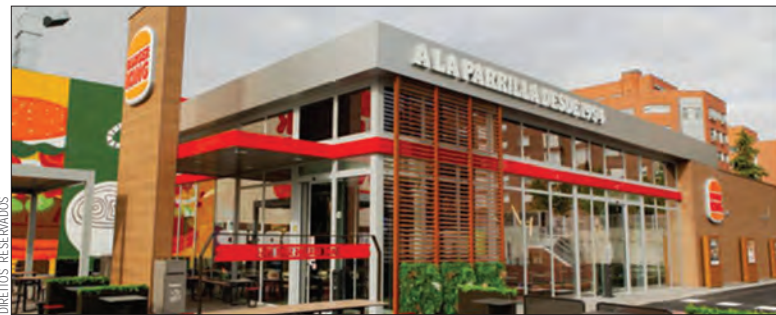
RB Iberia comprou 158 restaurantes da Cadeia Burger King

No entanto, a finalização da operação está condicionada à conclusão dos procedimentos regulatórios junto da Autoridade da Concorrência. ●