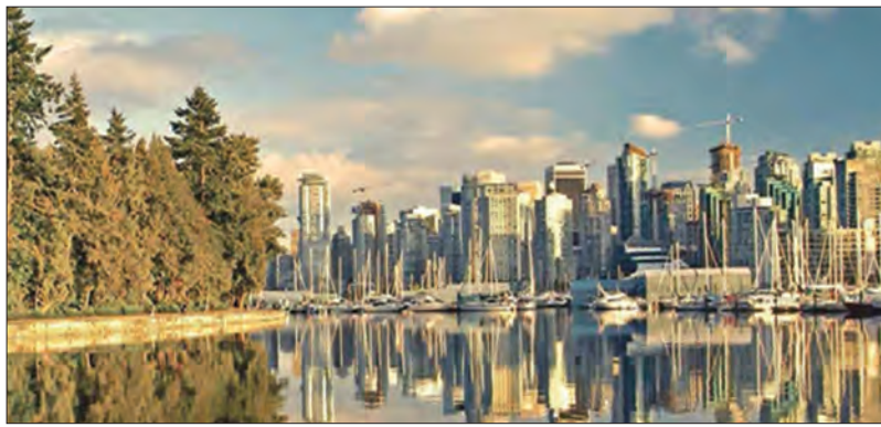
890 emigrantes portugueses escolheram o Canadá em 2021

Depois de em 2020, ano em que a pandemia de covid-19 obrigou a limitações na circulação, se ter registado um decréscimo no número de entradas de portugueses no Canadá, em