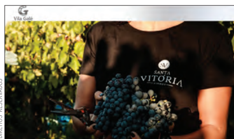
Vila Galé oferece pacotes especiais em agosto

Quem queira experimentar a tradicional pisa a pé, pode optar pelo pacote que já contempla as vindimas, o almoço e duas noites de alojamento – disponível a partir de 24 de agosto, com preços desde 210€ por pessoa. ●