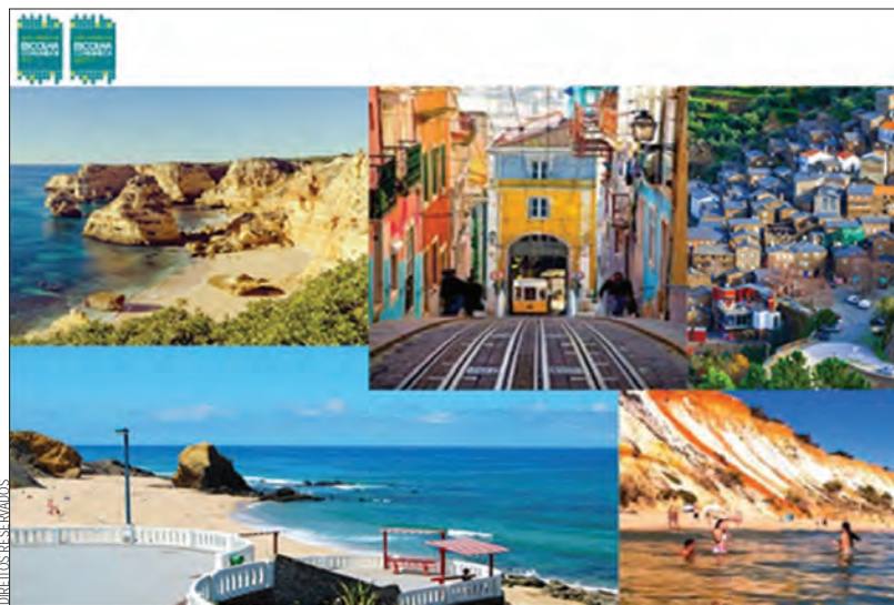
As férias grandes são um dos momentos mais esperados pelos portugueses

Caso o cenário fosse diferente e tivessem possibilidade de não terem qualquer limite de tempo ou orçamento, os consumidores gostariam de: dar a volta ao mundo ou ir às Maldivas, Tailândia, Indonésia, Grécia, entre outros. ●