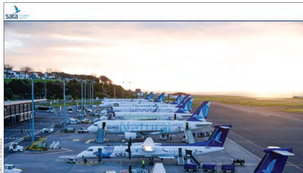
Grupo Sata alcançou a marca simbólica de um milhão de passageiros transportados a 31 de julho de 2022

Já em 2021 as companhias aéreas do grupo SATA haviam conhecido uma evolução muito positiva da procura, comportamento inesperado num setor muito afetado pelos efeitos da pandemia. Dado o histórico do ano anterior, antevia-se que as companhias aéreas viessem a registar o mesmo resultado, ou ligeiramente superior, no que respeita ao número de passageiros transportados. Mas, a marca simbólica de um milhão de passageiros transportados acabou por ser alcançada antes mesmo do registado em 2019, sendo que a 31 de julho de 2022, o grupo SATA atingia a marca de 1 milhão de passageiros transportados. Em suma, dez semanas mais cedo do que no ano de 2021 e dias antes do ocorrido no ano