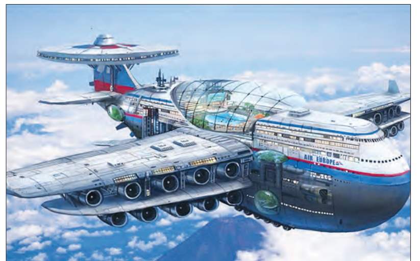
Cruzeiro teria um pequeno reator nuclear que não deixaria pegada de carbono

E, logicamente, esse meio luxuoso e futurista de transporte e alojamento teria, no estilo dos atuais navios de cruzeiro, entre muitas outras e variadas