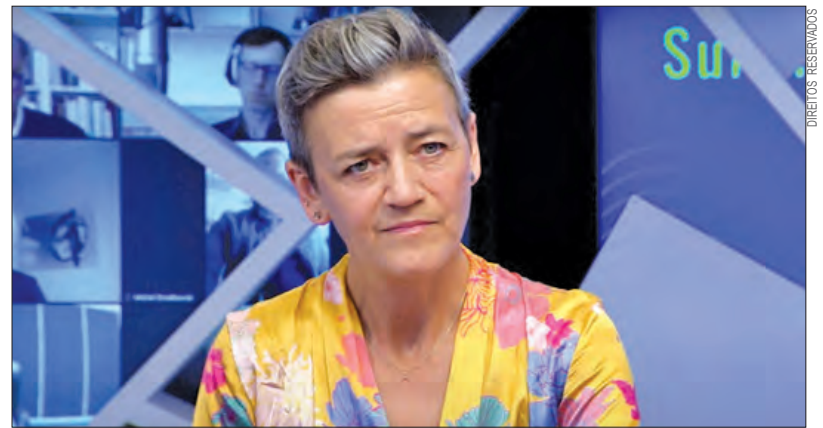
Margrethe Vestager, vice-presidente executiva da Comissão Europeia responsável pela Concorrência

A responsável europeia pela tutela lembrou que “as companhias aéreas são também obrigadas a indicar quais são os direitos