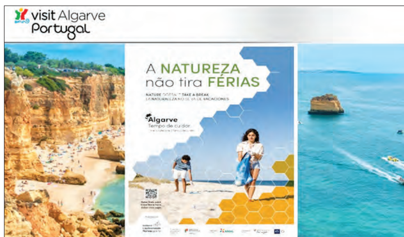
Nova campanha do Turismo do Algarve

“A Natureza não tira férias” é o ‘claim’ da nova campanha do Turismo do Algarve que pretende sensibilizar para um turismo sustentável e chamar a atenção para as consequências das alterações climáticas no destino e que se prolonga até setembro, apelando a que as boas práticas sejam mantidas por todos, mesmo em período de férias.