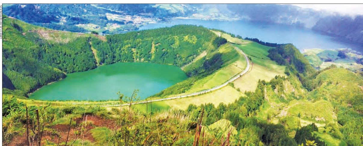
Miradouro da Boca do Inferno, São Miguel, Açores

As praias dos sonhos nas ilhas gregas de Creta e Santorini apaixonaram os viajantes