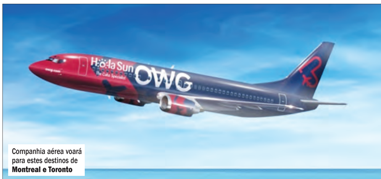
Companhia aérea voará para estes destinos de Montreal e Toronto

A companhia aérea voará para estes destinos de Montreal e Toronto, com quatro frequências semanais em cada rota (quinta a domingo). ●