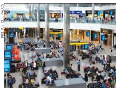
Aeroporto de Heathrow, Londres

Segundo aquele responsável, toda esta situação fica a dever-se à escassez de pessoal no aeroporto, apesar de já ter sido iniciado um programa de