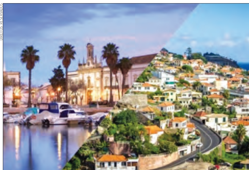
Distinção divulgada num documento da Agência Europeia do Ambiente (AEA)

A AEA analisou também os progressos dos Estados mem-