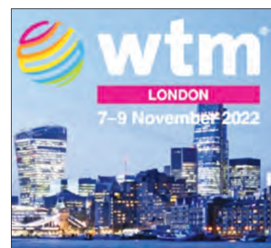
World Travel Market (WTM) 2022

Além da exposição, as sessões técnicas da feira incluirão seminários onde especialistas apresentarão casos práticos sobre