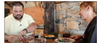
Produção da Turismo do Centro

A Turismo do Centro explicou que o projeto inclui também um livro com o mesmo nome,