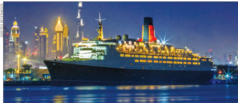
“Lendário” navio britânico ‘Queen Elizabeth 2’

➤ O ‘novo’ MGallery Queen Elizabeth 2 passará por um processo de renovação