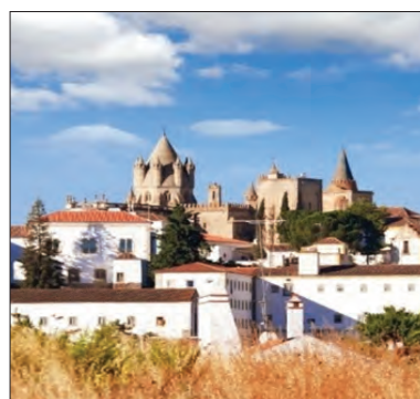
Caminhos de Santiago

Castro Verde, São Domingos, Santiago do Cacém, Grândola ou Alcácer do Sal são algumas das paragens que compõem esse passeio e que oferecem os car-