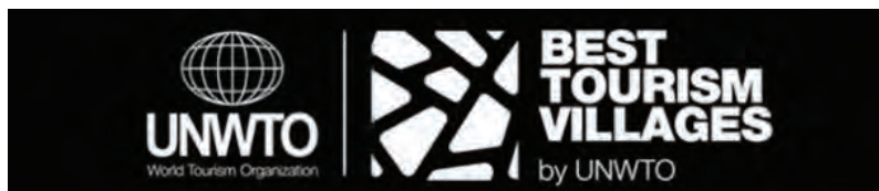
O prazo para inscrições está aberto até ao dia 28 de junho

O ‘Best Tourism Villages’ destaca exemplos de destinos turísticos rurais com bens culturais e naturais reconhecidos. Da mesma forma, esses povos devem ter um compromisso com a inovação e a sustentabilidade em todos os seus aspetos: económico, social e ambiental. O reconhecimento desses