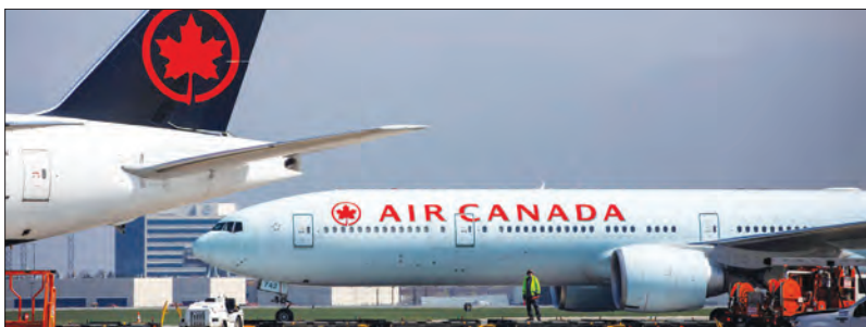
Air Canada dá sinais de recuperação

A Air Canada recebeu um total de 100.701 pessoas a bordo só no dia 15 de abril, número que não era alcançado desde março de 2020, quando o trans-