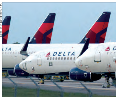
Delta Air Lines anuncia prejuízos

A Delta prevê receitas no segundo trimestre que representam cerca de 95% dos níveis pré-pandemia, acima dos 89% do primeiro trimestre, mas prepara-se para despesas mais