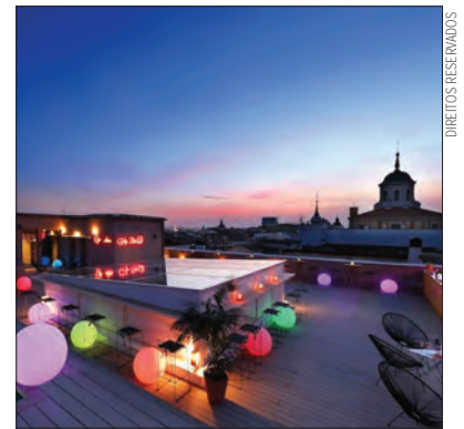
Axel Hotels vai ter dois hotéis em Portugal

Com essas quatro novas inaugurações nos próximos anos, a Axel Hotels expandirá o seu portfólio atual, composto por dez hotéis espalhados por