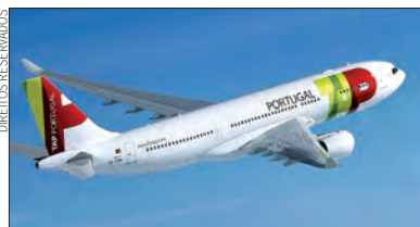
Processo será proposto aos acionistas

O Grupo TAP vai iniciar nos próximos meses o processo de integrar a Portugal Airlines (PGA) e a UCS - Cuidados Integrados de Saúde na TAP, S.A., a empresa de aviação do grupo que é detida exclusivamente pelo Estado.