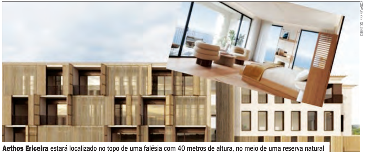
Aethos Ericeira estará localizado no topo de uma falésia com 40 metros de altura, no meio de uma reserva natural

e banheira de hidromassagem. A área de spa inclui ainda um hamam, salas de tratamento e ginásio. ●