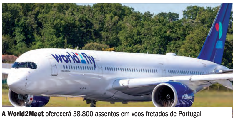
A World2Meet oferecerá 38.800 assentos em voos fretados de Portugal

a World2Meet, divisão de viagens da Iberostar, oferecerá 38.800 assentos em voos fretados de Portugal para destinos caribenhos ou ao sul da Flórida este ano. Em Portugal, a empresa possui um Airbus A330-300 com capacidade para 388 passageiros.