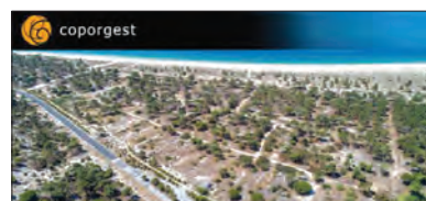
Novo resort em Troia

muito próximos da praia, o novo 'resort' inclui um hotel de cinco estrelas com 58 quartos e suites, incluindo duas suites presidenciais, sendo complementado por 38 'villas' de tipologias V2, V3 e V4, e por 91 apartamentos turísticos com tipologias T1, T2 e T3. Todas as unidades terão vista de mar.