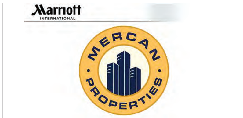
Grupo canadiano Mercan reforça investimento em Portugal

O Marriott Lagos - um investimento de 98 milhões de