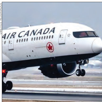
Ligações retomadas em maio

Entre os meses de abril e junho a Air Canada planeja colo-