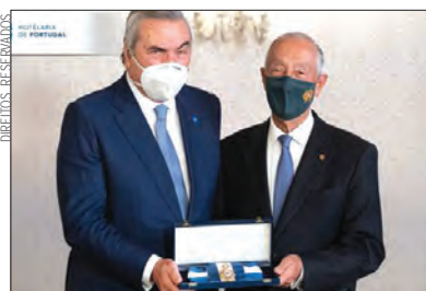
Presidente distingue AHP