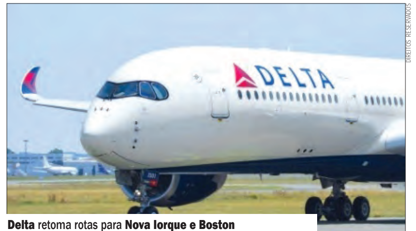
Delta retoma rotas para Nova Iorque e Boston

Os voos, ao longo de todo o ano, da Delta para Nova Iorque-JFK e o serviço de verão de/ para Boston vão ser operados em aviões Boeing 767-300, em conjunto com os parceiros da 'joint-venture' transatlântica da Delta, Air France, KLM e Virgin Atlantic. ●