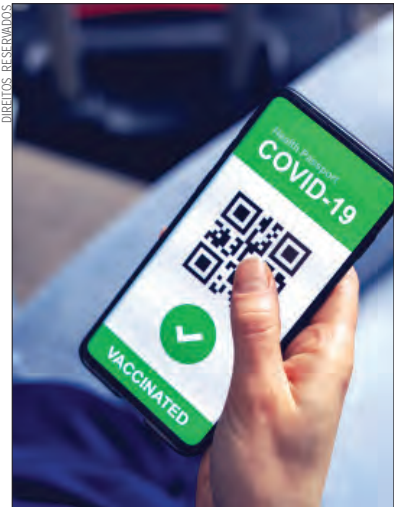
Proposta avançada pela CE

No entanto, estas regras não se aplicam aos certificados relativos à vacina de reforço.