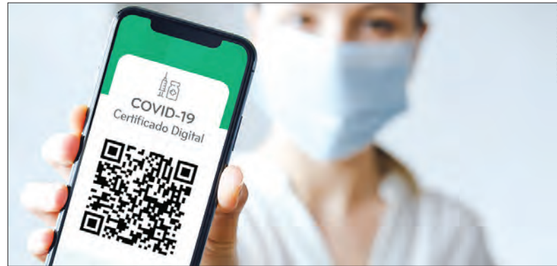
Certificado passa também a incluir a informação relativa às doses de reforço

Recorde-se que desde a passada terça-feira, dia 1 de feve-