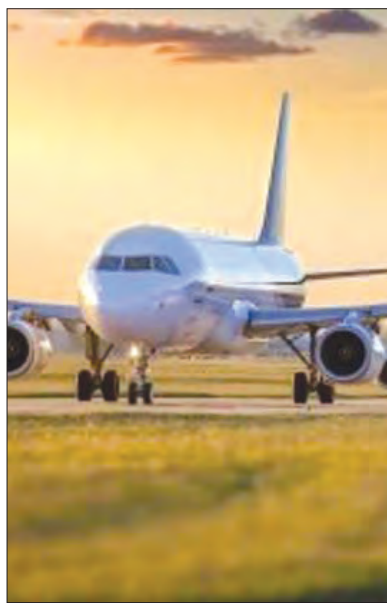
Recuperação do setor da aviação

É o caso da Eurowings, companhia aérea alemã do grupo Lufthansa, que, prevendo um aumento da procura a curto prazo, está a recrutar 750 tripulantes de cabine, tanto para