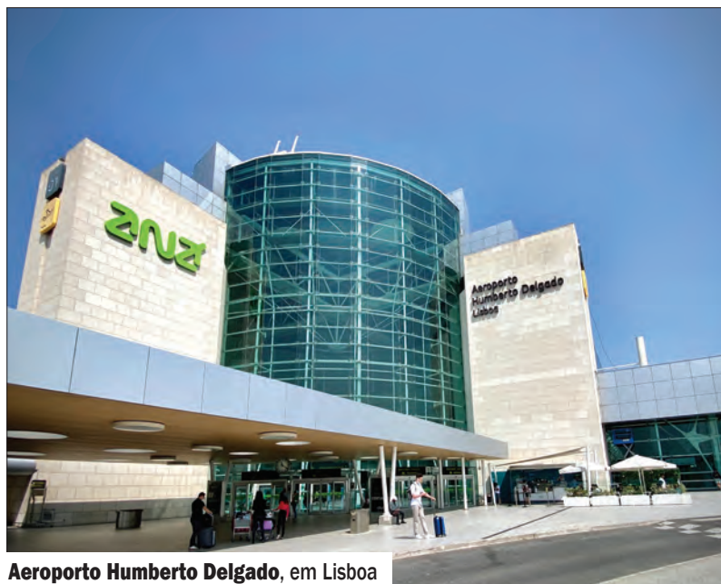
Aeroporto Humberto Delgado, em Lisboa

O fim da exigência de teste negativo aplica-se também nas