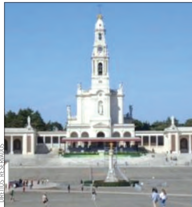
Centro Pastoral Paulo VI, em Fátima

O evento é dirigido sobretudo aos operadores turísticos, agentes de viagem e hoteleiros nacionais, e contarão com a participação de operadores de