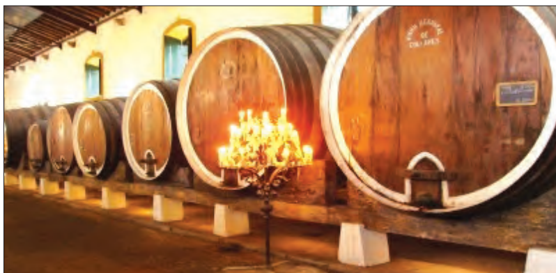
A Cooperativa Adega Regional de Colares iniciou a sua atividade em 1931

guem a região demarcada de Colares, produzindo ambos vinho tinto e branco. O famoso Chão de Areia e, o Chão Rijo, cujas castas diferem das anteriores.