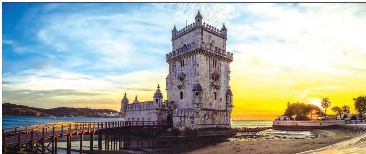
Torre de Belém, em Lisboa

A empresa canadiana, com sede em Toronto, refere que o turismo estrangeiro “recuperou mais rapidamente na Grécia e em