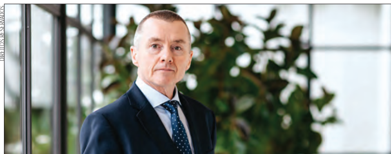
Willie Walsh, director geral da International Air Transport Association (IATA)

➤ Em causa, as políticas erráticas em torno da Covid-19