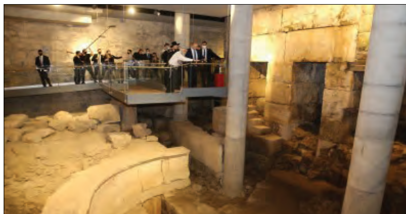
O Muro das Lamentações é um dos ícones turísticos mais globais de Israel

➤ É o local mais sagrado para os judeus e imperdível para os demais visitantes