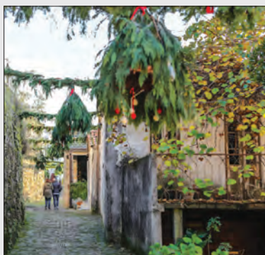
Serra da Estrela

segurança e magia e que seja tão natural quanto possível. Não irá faltar a neve, o conforto da lareira, os produtos tradicionais, as tradições seculares, a identidade de cada território, os produtos únicos que não podem deixar de marcar presença numa casa portuguesa, como o Queijo Serra da Estrela DOP, os azeites de montanha, o burel, a doçaria tradicional, o mel, os frutos secos, o pão e os melhores vinhos do território. Neste outono/inverno, a Serra recebe os primeiros nevões e ‘veste-se’ de branco com todo o seu esplendor e gáudio de todos aqueles que querem viver o Natal intensamente.